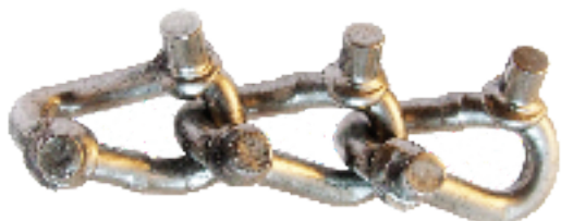
Dygliuota skersinė jungtis