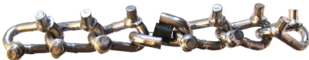
Remontinė jungtis trūkus grandinei

Jei grandinė trūko ar atsirado kitų gedimų, jie turi būti remontuojami nedelsiant. Trūkusią grandinę galima sutvarkyti naudojant remontinę jungtį, kuria taip pat galima pakeisti ir lūžusį kablį. Guminis kamštis neleidžia atsikabinti grandinės galams.